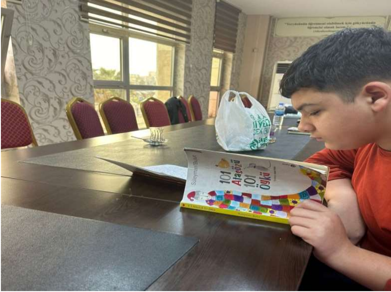
Destek odasında Deyimler ve Atasözleri Öyküleri çalışması